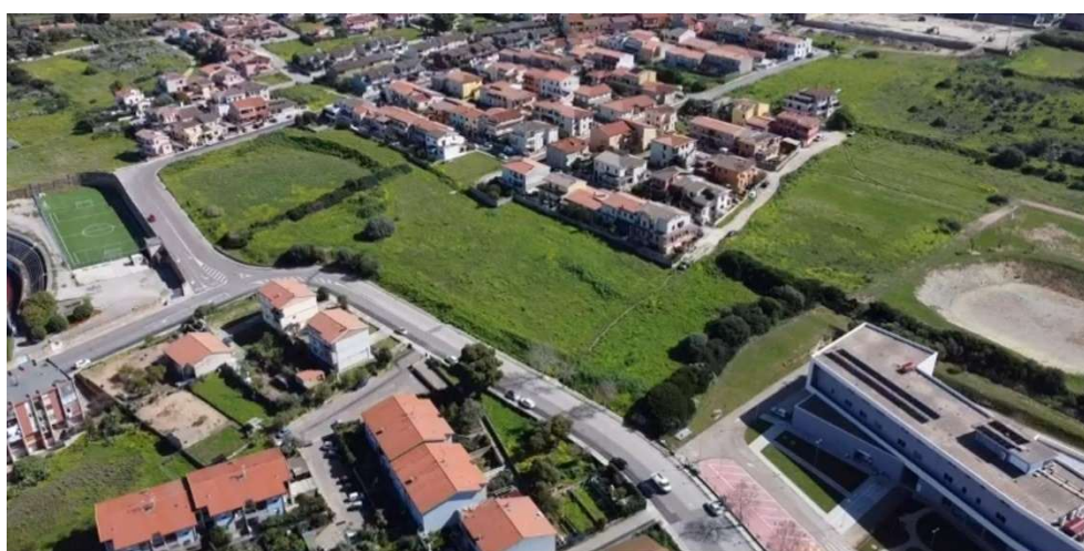
1 – Vista panoramica stato attuale