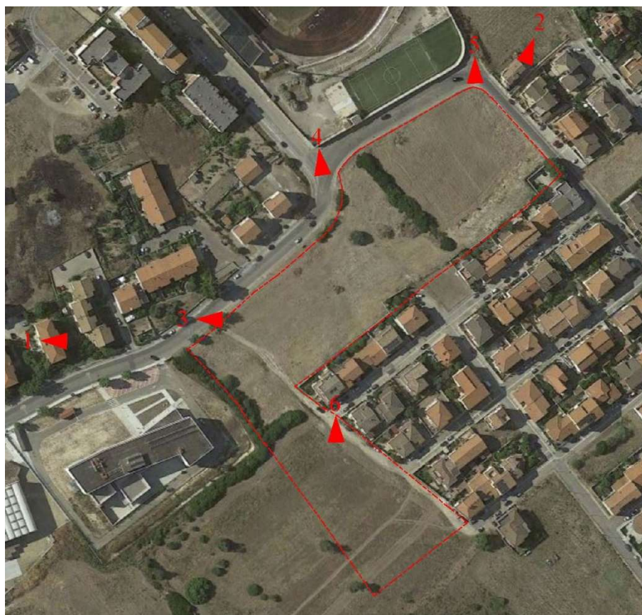
Planimetria con punti di ripresa fotografica