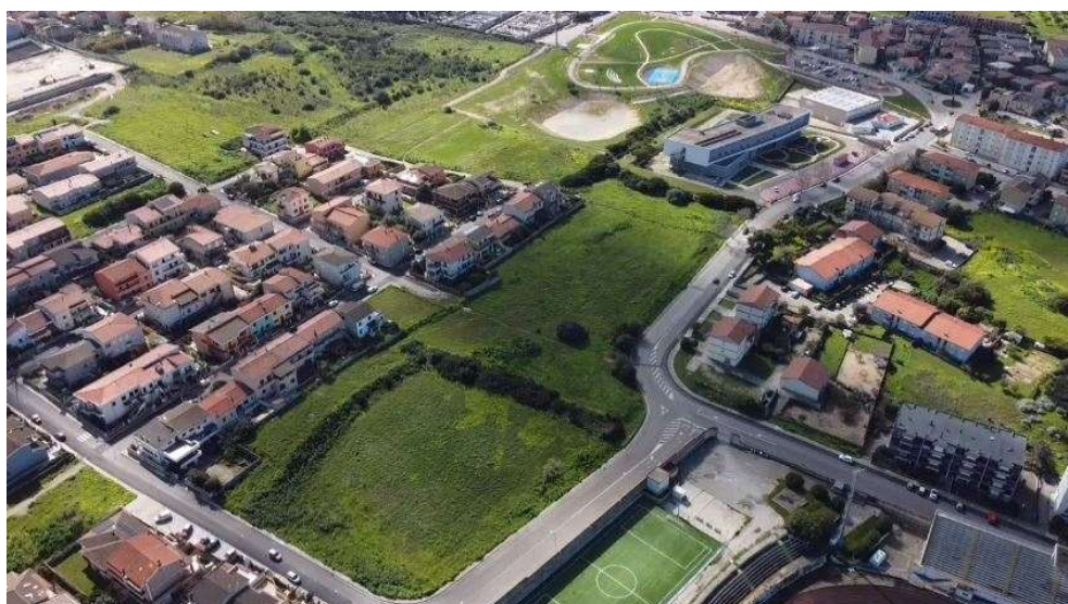
2 – Vista panoramica stato attuale