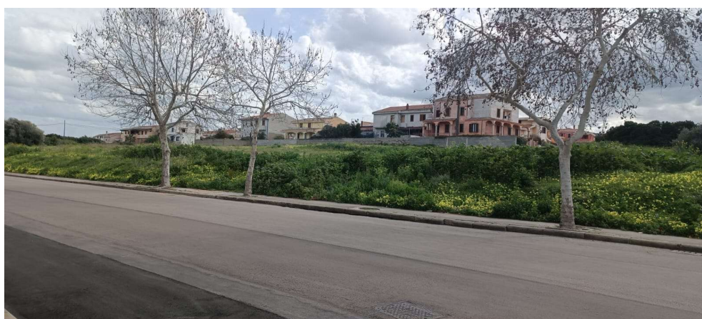
3 – Vista stato attuale dalla via G. Dessi