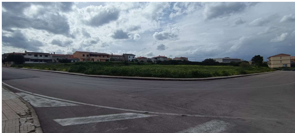
5 – Vista stato attuale dalla via P. Antonio Manca