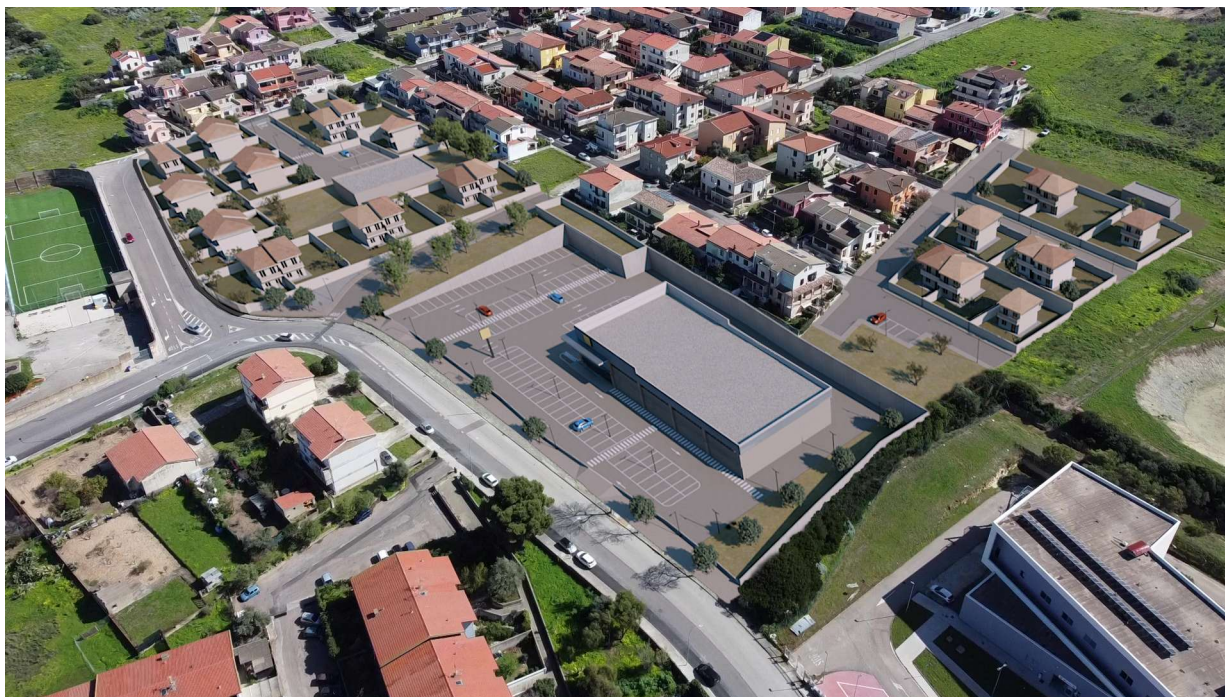
Render di progetto