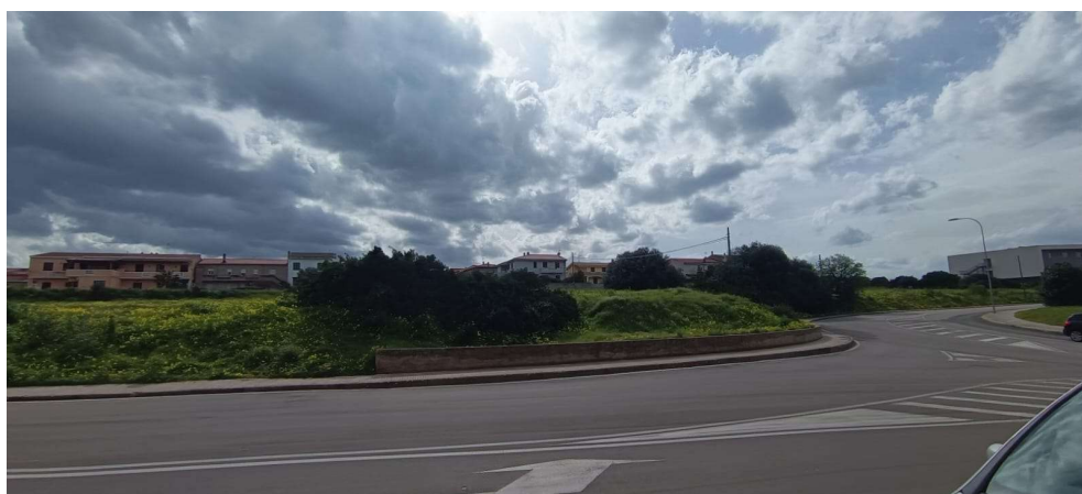
4 – Vista stato attuale dalla via P. Antonio Manca