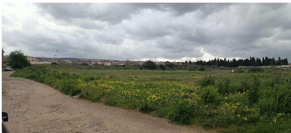
6 – Vista stato attuale dalla via Nivola