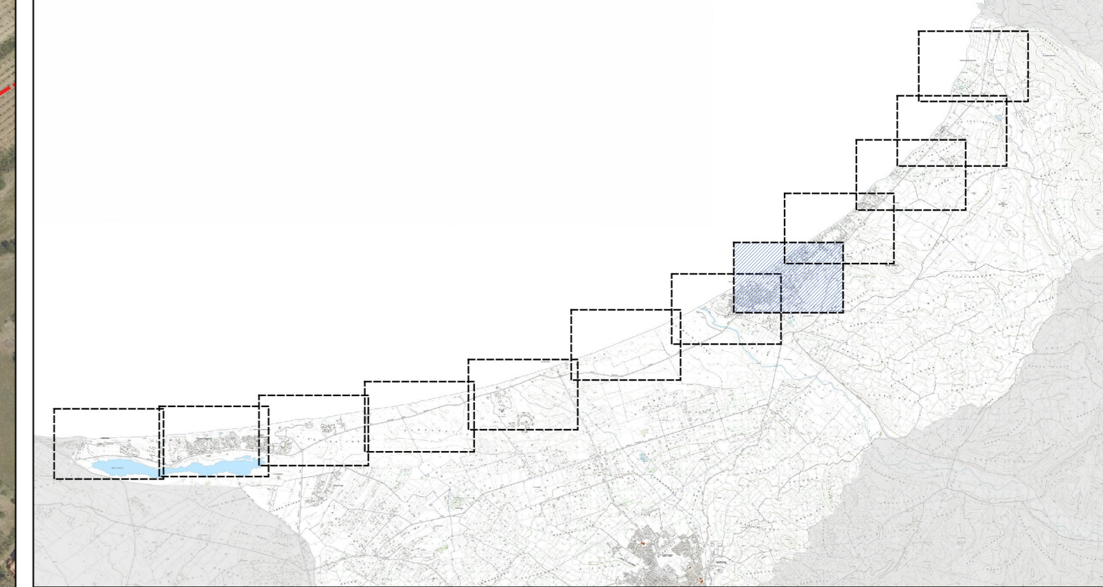
Inquadramento territoriale in scala 1:80.000