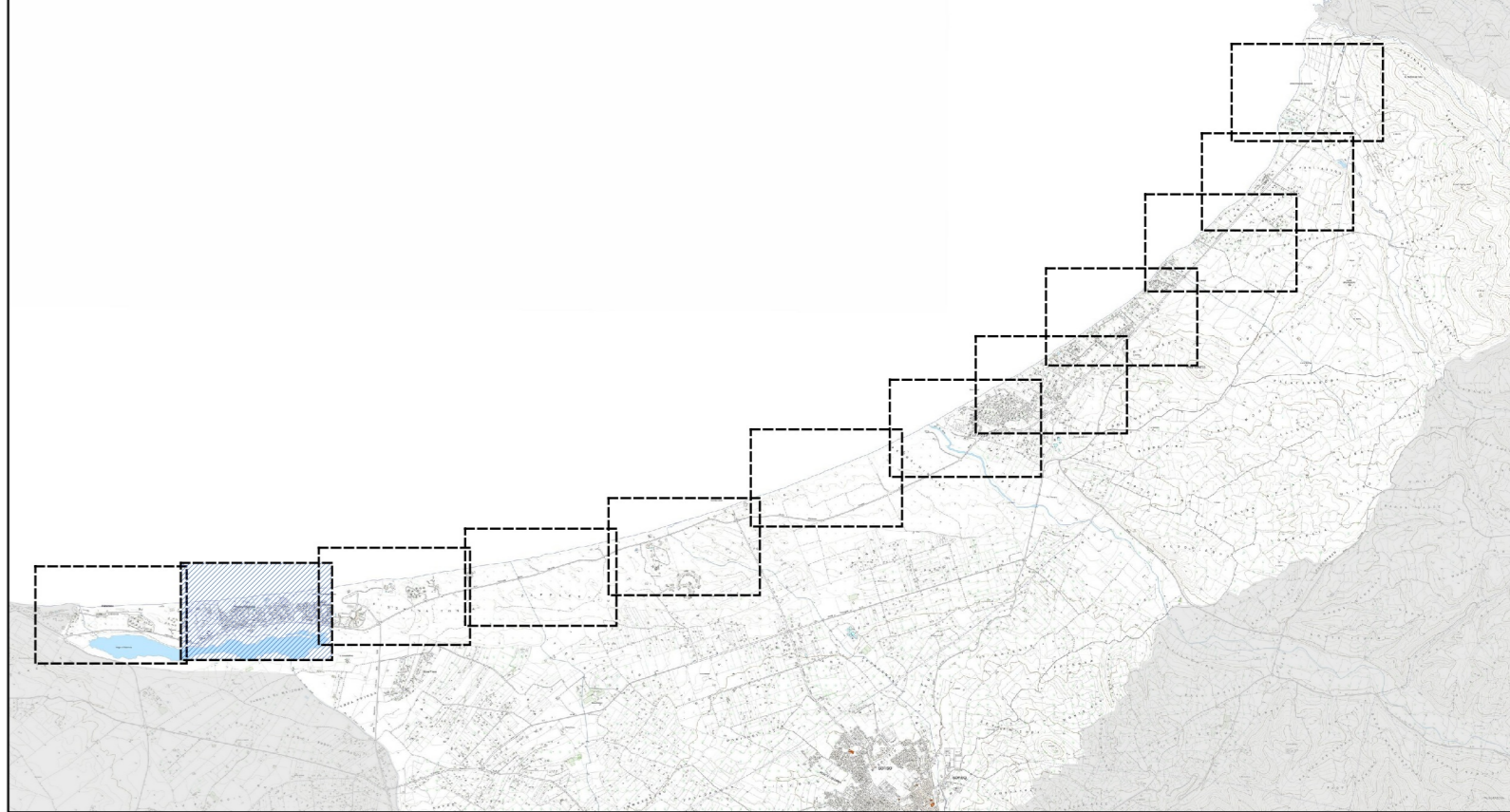
Inquadramento territoriale in scala 1:80.000