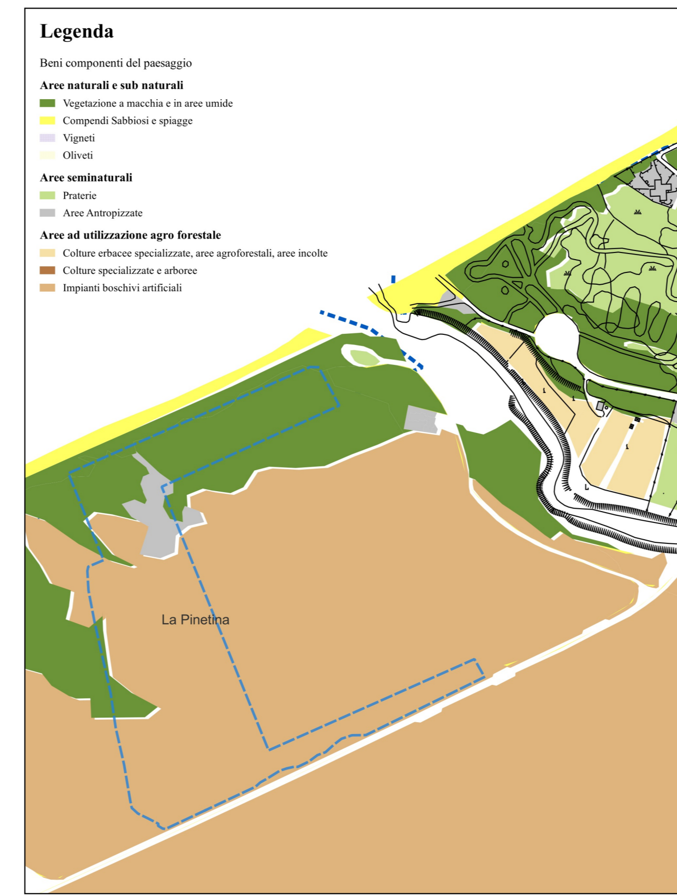
Stralcio carta delle componenti ambientali Scala 1:5.000