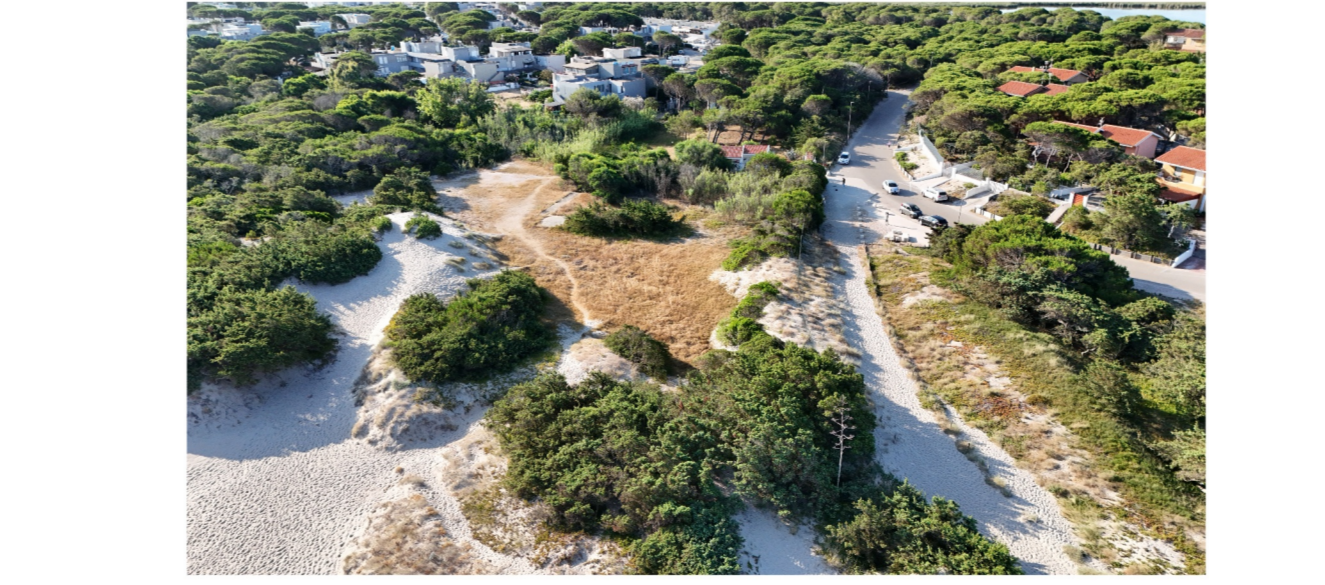
Stralci carta delle componenti ambientali Scala 1:2.000