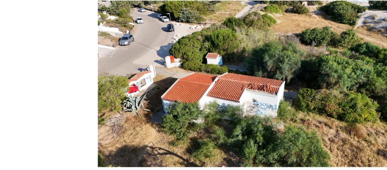
Ulteriori vincoli ambientali Scala 1:2.000