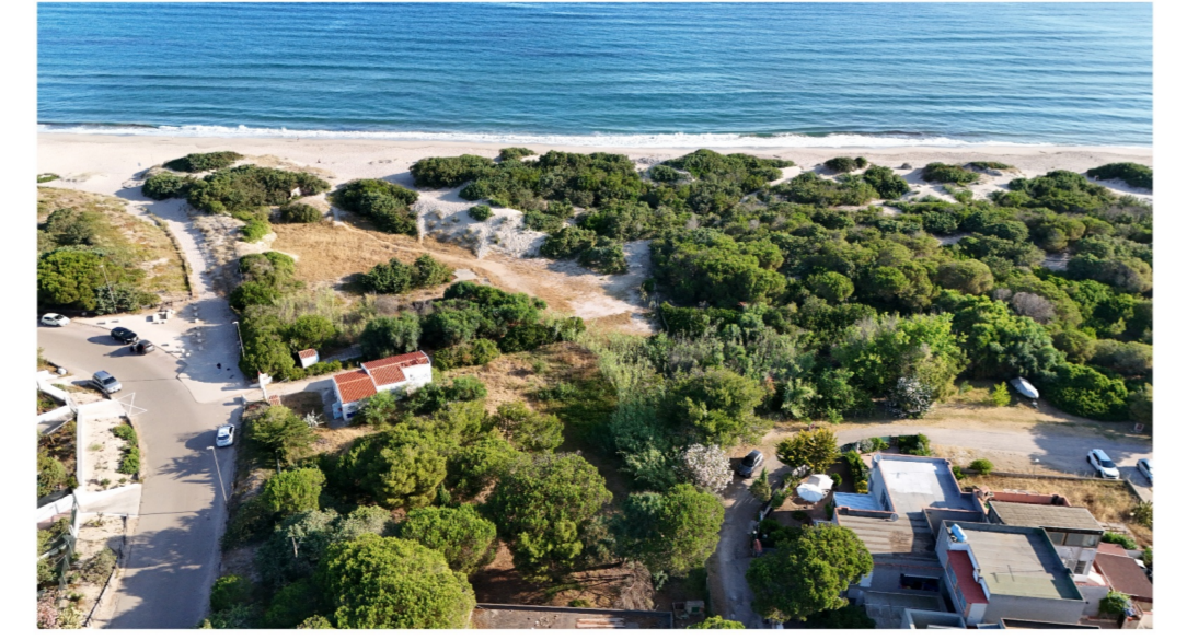
Stralci carta dei beni paesaggistici ambientali Scala 1:2.000